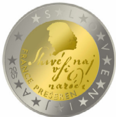
2 EVRA – France Prešeren