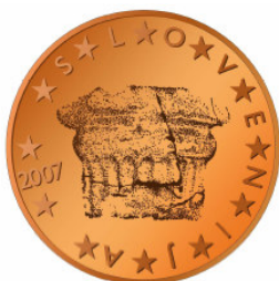
2 centa – Knežji kamen