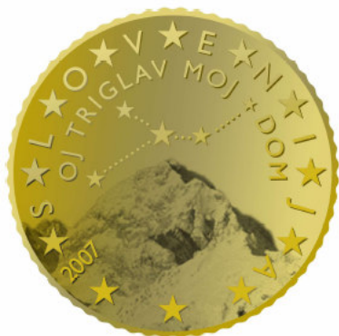
50 centov – Triglav