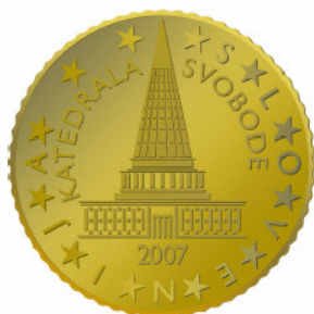
10 centov – osnutek Plečnikovega parlamenta