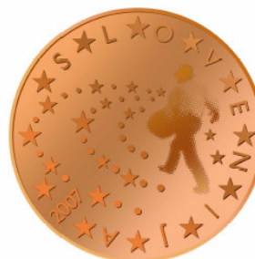
5 centov – Groharjev Sejalec