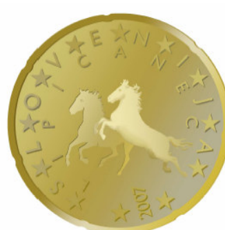
20 centov - Lipicanec