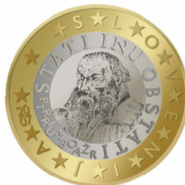
1 EVRO – Primož Trubar